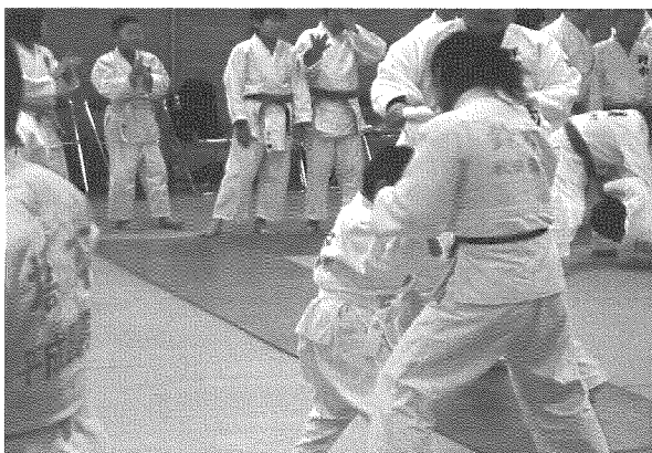
大学生との打ち込み！