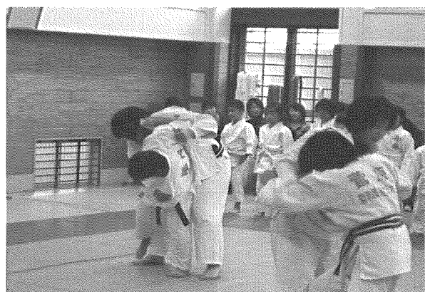
大学生との乱取り練習！