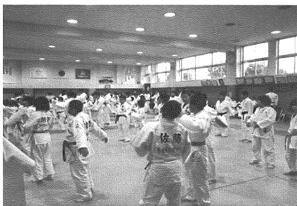
最後にしっかり整理運動！