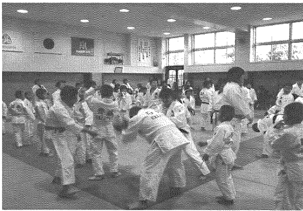
ボール送りで体をほぐし！

そして、柔道教室の企画・運営に携わった大学生は、普段とは違う立場である指導者として柔道教室に参加することで、いい経験をさせていただいた。参加していただいた各団体の指導者方々に深謝申し上げるとともに、今後も継続してこのような柔道教室を継続させていただき、学生と指導者の学びの機会としたい。